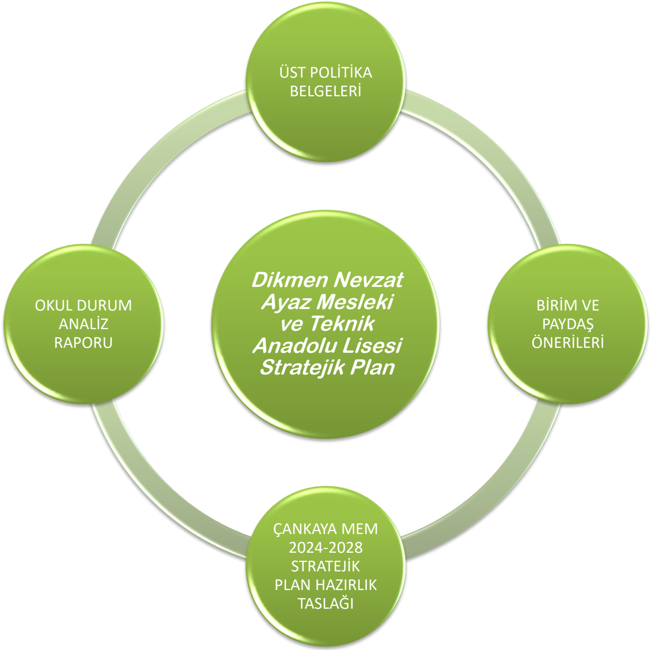
Şekil. 1. Dikmen Nevzat Ayaz Mesleki ve Teknik Anadolu Lisesi 2024-2028 Stratejik Plan Oluşum Şeması